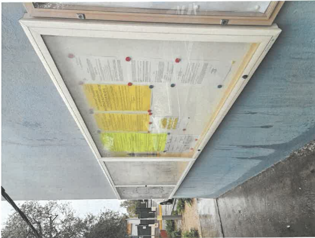
Photo N°4 - 20240105_131941 Commentaire :urbanisme